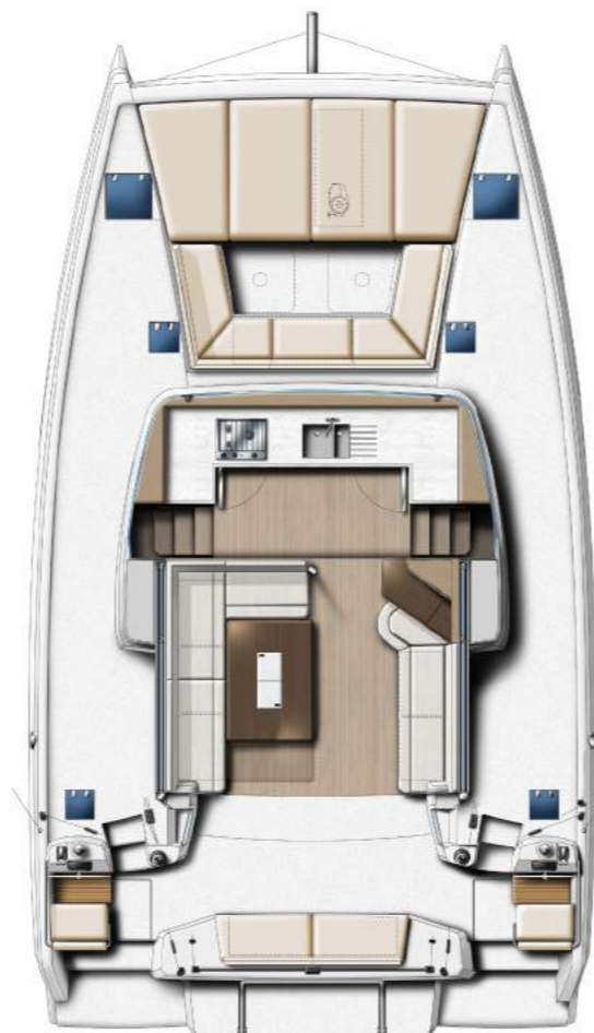
COCKPITS AND SALOON COCKPITS & SALON