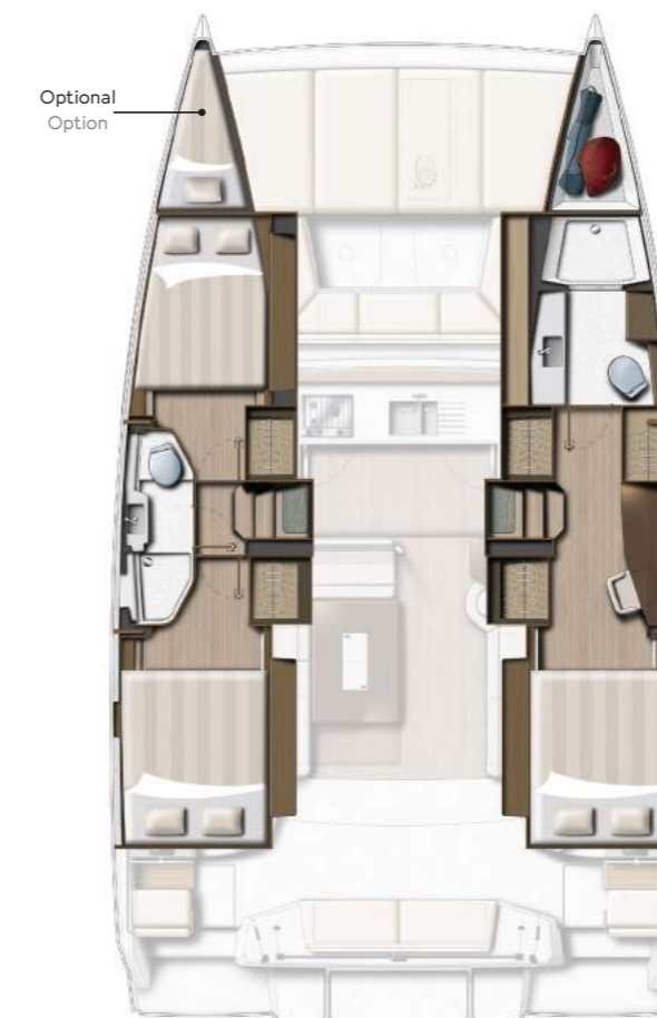
3 DOUBLE CABINS / 2 HEADS VERSION VERSION 3 CABINES DOUBLES / 2 SDB