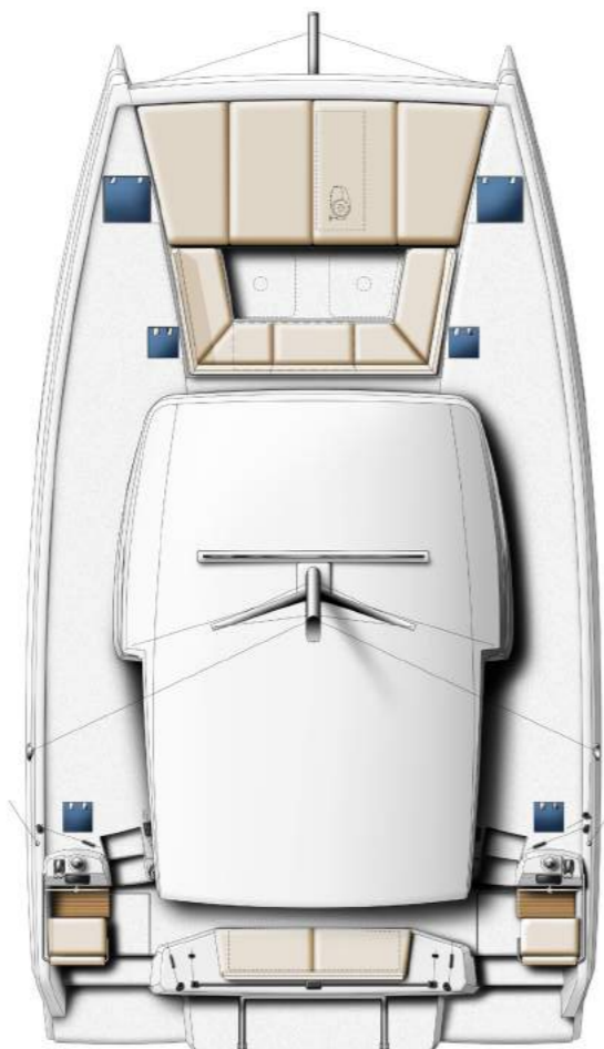
DECK AND FLYBRIDGE PONT & FLYBRIDGE