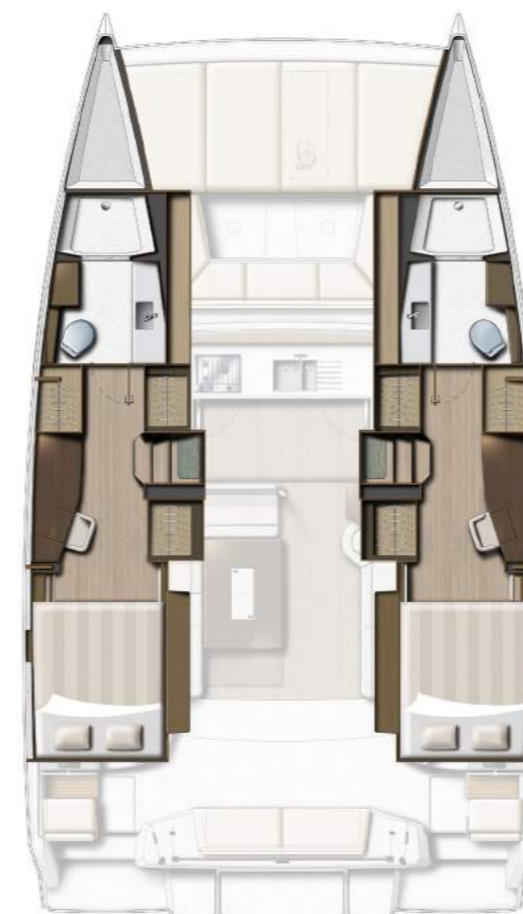
2 DOUBLE CABINS / 2 HEADS VERSION VERSION 2 CABINES DOUBLES / 2 SDB