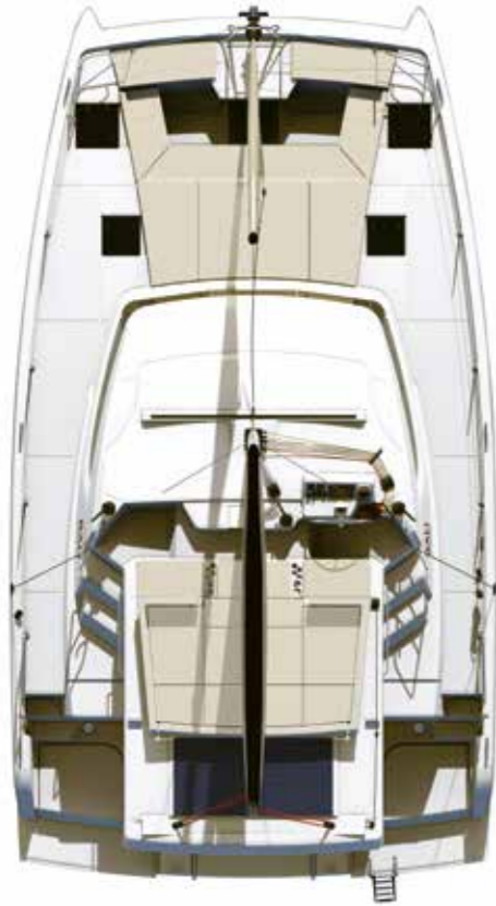
DECK AND FLYBRIDGE Pont et flybridge