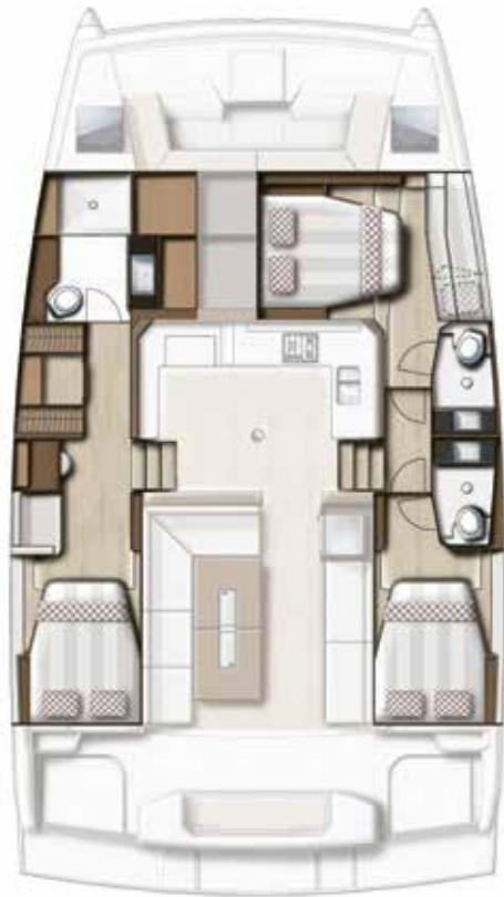
3 CABIN VERSION / 3 BATHS Version 3 cabines / 3 sdb