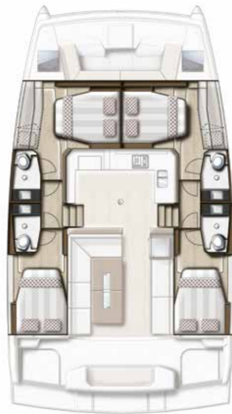
4 CABIN VERSION / 4 BATHS Version 4 cabines / 4 sdb