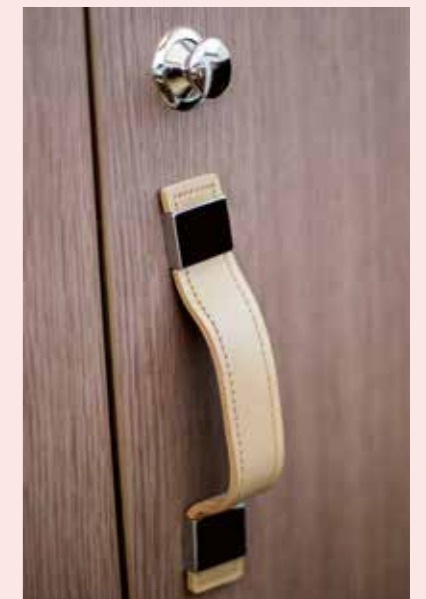
01. HOME LIKE 265 LITER (9.36 CU FT) FRIDGE/FREEZER RÉFRIGÉRATEUR / CONGÉLATEUR DE 265 L COMME À LA MAISON