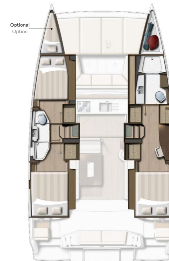
3 DOUBLE CABINS / 2 HEADS VERSION VERSION 3 CABINES DOUBLES / 2 SDB