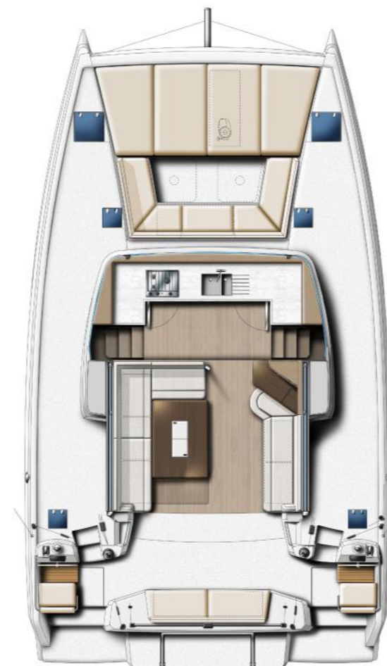
COCKPITS AND SALOON COCKPITS & SALON