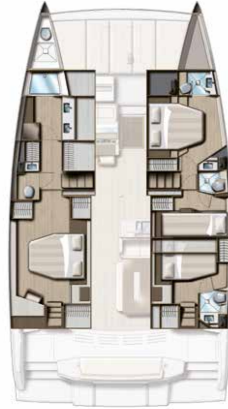
4 CABIN VERSION (owner) / 4 BATHS Version 4 cabines / 4 sdb (coque propriétaire)