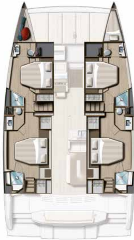
4 CABIN VERSION / 4 BATHS Version 4 cabines DOUBLES / 4 sdb