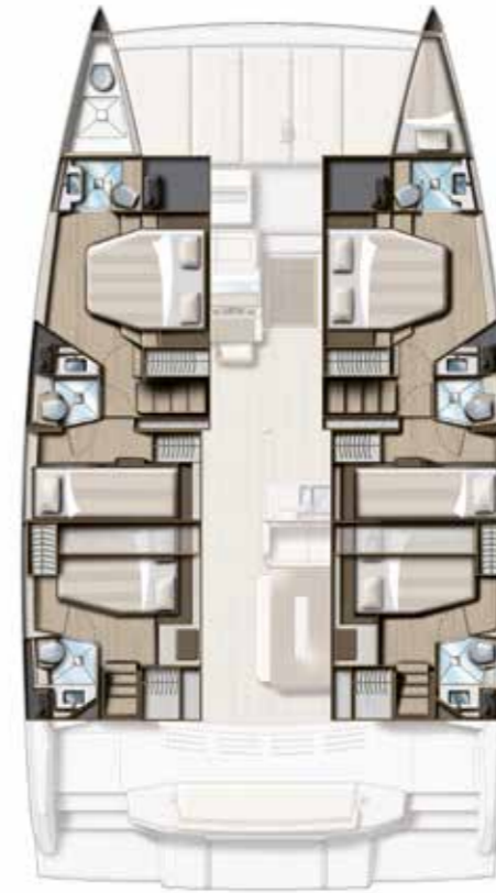
6 CABIN VERSION / 6 BATHS Version 6 cabines / 6 sdb