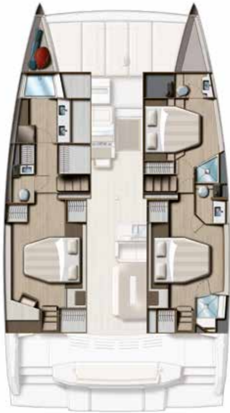
3 CABIN VERSION / 3 BATHS Version 3 cabines DOUBLES / 3 sdb