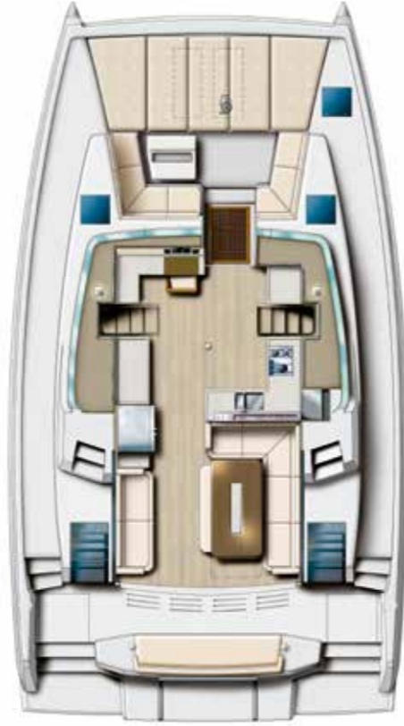
COCKPITE AND SALON Cockpit & Salon