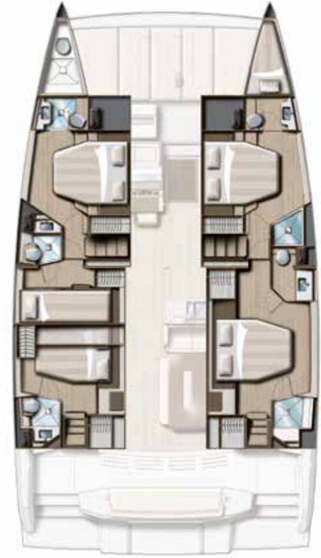
5 CABIN VERSION (4 DOUBLE + 1 TWIN) / 5 BATHS Cockpit & Salon Version 5 cabines (4 DOUBLES + 1 TWIN) / 5 sdb