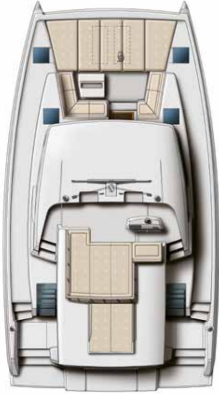
DECK AND FLYBRIDGE Pont & flybridge